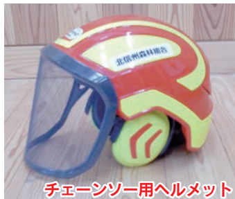
チェンソー用ヘルメット