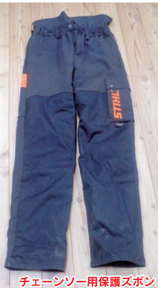
チェンソー用保護ズボン