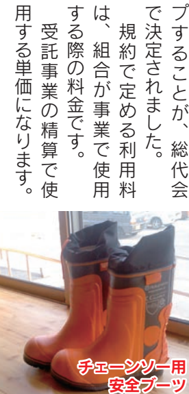
チェンソー用安全ブーツ

現場でのチェーンソーによる切創事故防止と、耳栓やゴーグルの不着装に対して、注意喚起による指導をしてきましたが、事故を減らすことができないうえです。このため、安全防具により、物理的リスク軽減を行うこととしました。 また、安全防具については、欧州のチェーンソー切断保護基準クラス1以上の物を装備することとなりました。 この費用についてチェーンソーの利用料を一日あたり三〇〇円アップすることが、総代会で決定されました。 規約で定める利用料は、組合が事業で使用する際の料金です。 受託事業の精算で使用する単価になります。