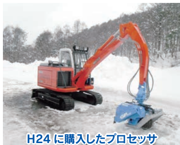
H24 に購入したプロセッサ