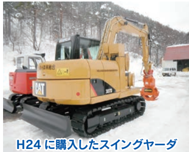
H24 に購入したスイングヤード