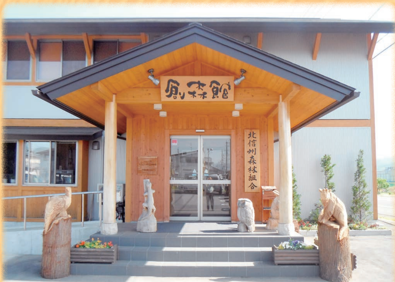
…… 本所玄関にある県獣のカモシカと県鳥のライチョウの木像 ……

E-mail musasabi@jforest-kitashinshu.or.jp