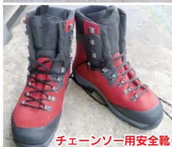
チェンソー用安全靴