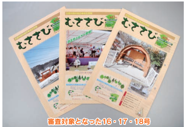
審査対象となった16・17・18号