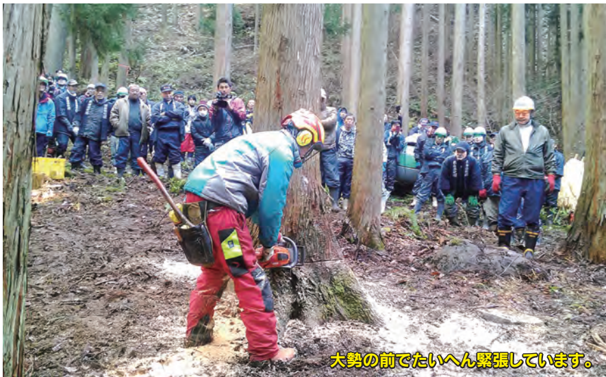
大勢の前でたいへん緊張しています。