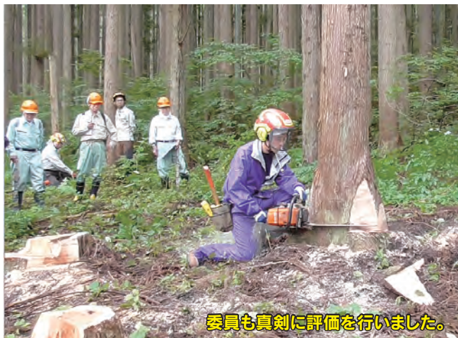
委員も真剣に評価を行いました。

今年も伐倒作業での災害が多く発生し、長期の休業となる事案もありました。そこで林産班・造林班の全員を対象に伐倒技能評定を行いました。 8月20日から24日、9月15日から17日の中で6回に分けて、個別に伐倒作業を確認し、基本動作の遵守など個別に安全指導など行いました。 平成25年3月にチェーンソー整備講習を行った際に、チェーンソーの目立て不良が多く見られましたので、安定した目立てができるよう、チェーンソー目立てゲージを配布しました。 今回は、目立てゲージの効果もあり、その時にくらべると目立ての状況は、だいぶ改善していました。