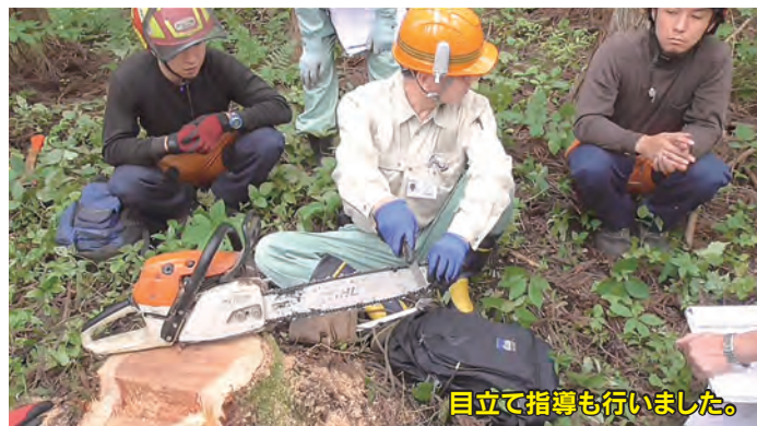
目立て指導も行いました。

これがあればチェーンソーの目立てが簡単にできます。 当組合でも注文販売しています。 目立てでお悩みの方は、ぜひ使ってみてください。