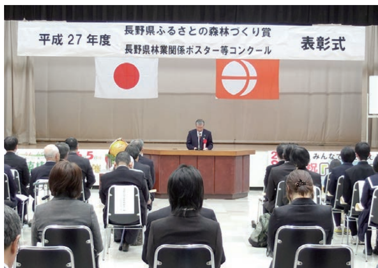
中山組合長が受賞者を代表して謝辞

森林組合が森林整備を行うのは、業としてあたり前のことであり、これまでは賞の対象となることはありませんでしたが、当組合の先進的な取組みが評価され、森林組合として初めての受賞となりました。