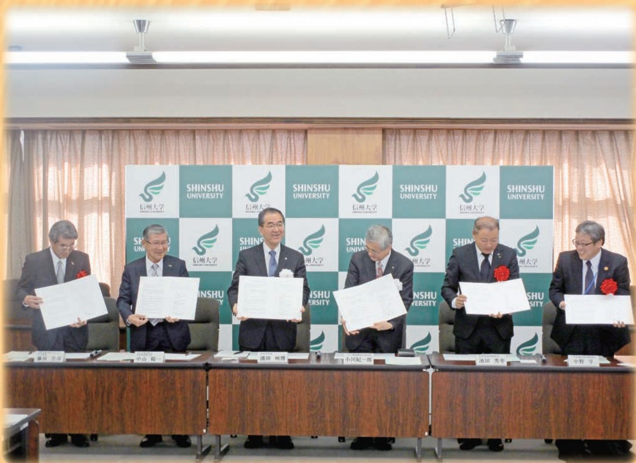
レーザーセンシング情報を使用した持続的なスマート精密林業技術の開発に関する覚書調印式 (6ページに掲載)

E-mail musasabi@jforest-kitashinshu.or.jp