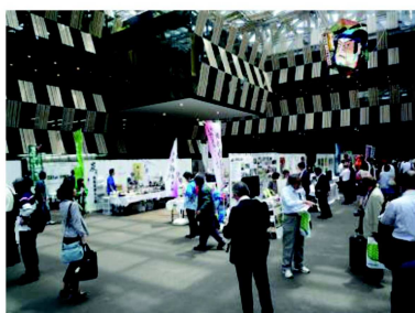
第43回全国林業後継者大会（新潟県）の様子